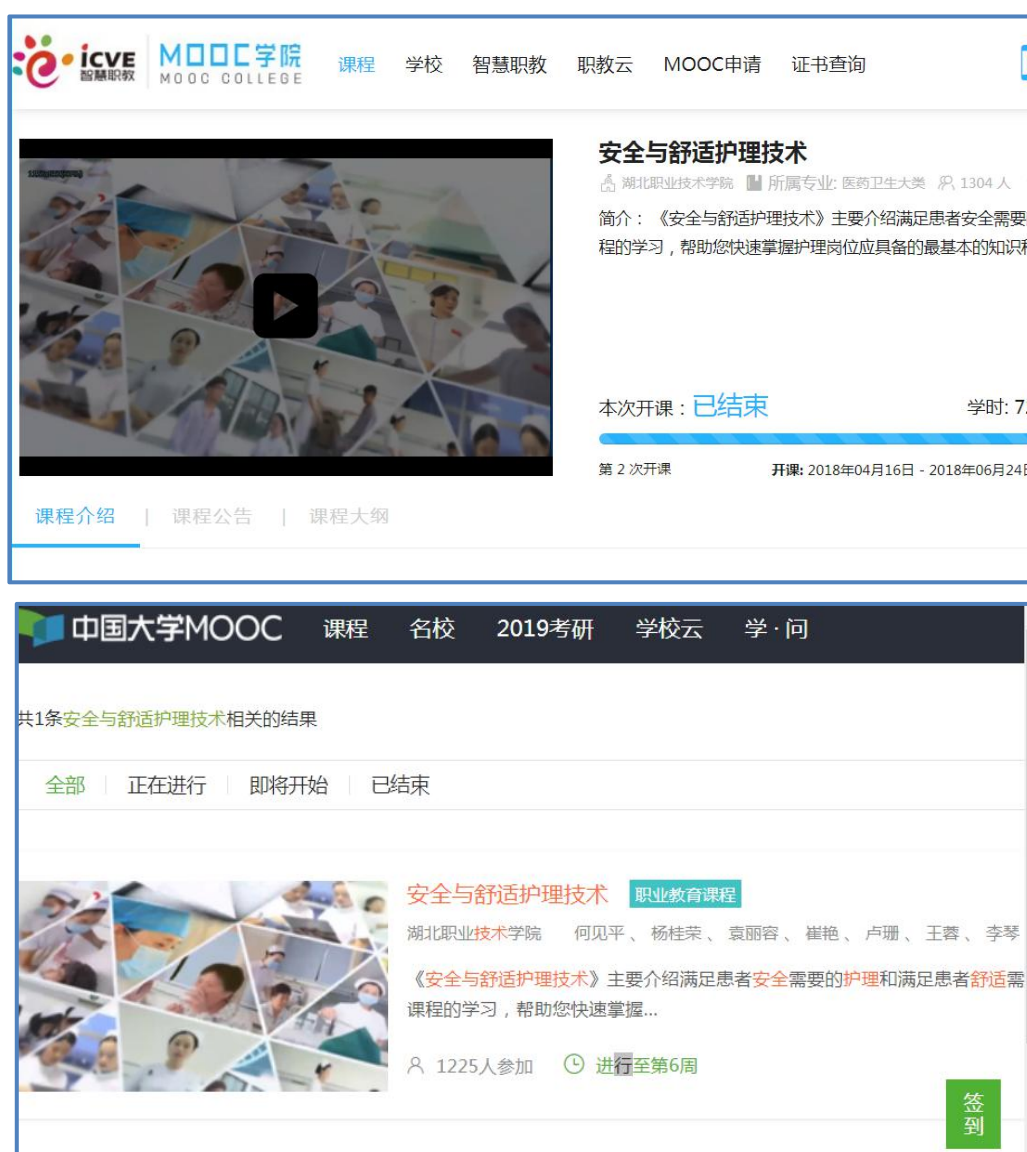
图9 《安全与舒适护理技术》线上运行截图