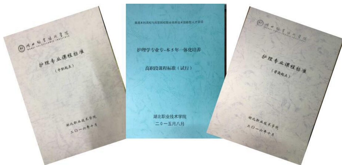
图 1 三类生源课程标准