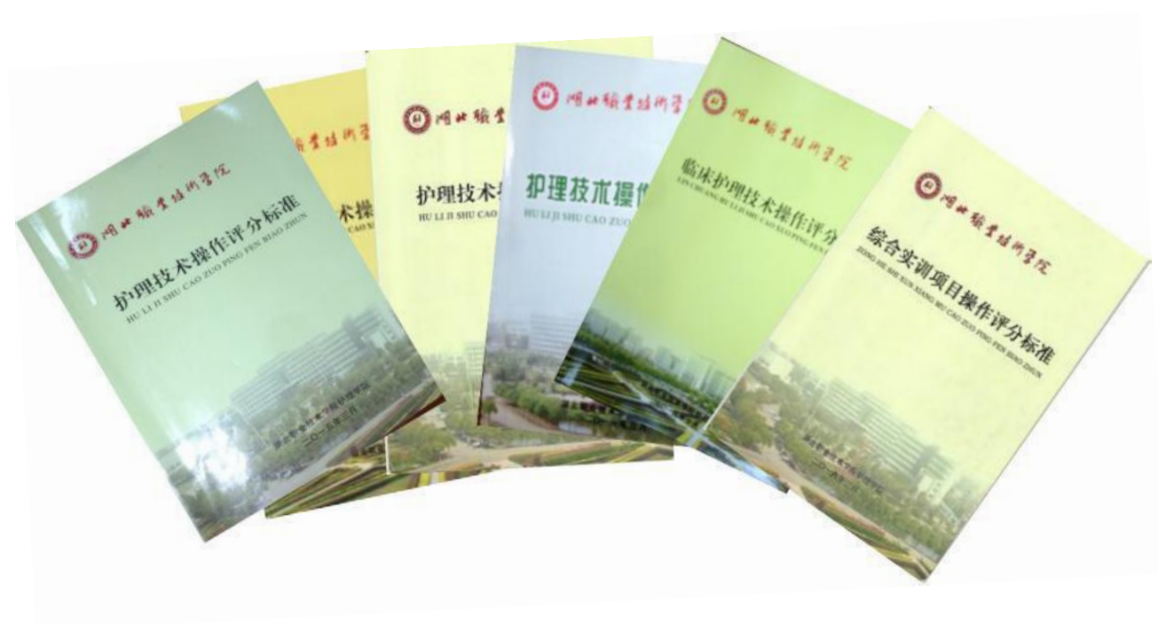
图4 各科专业技能评分标准