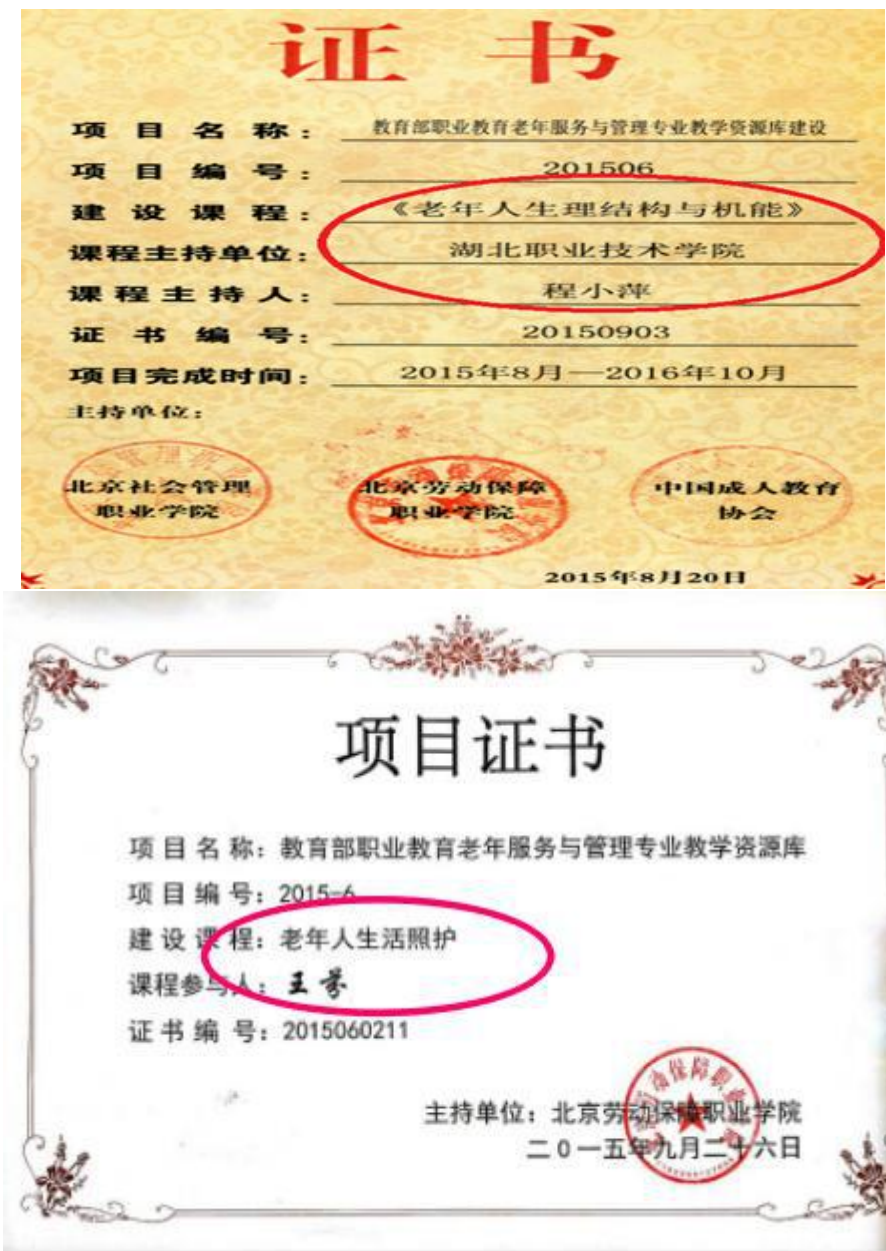
图 10 教育部老年服务与管理专业教学资源库项目建设证书

部老年服务与管理专业教学资源库项目建设，承担或参与了《老年人 生理结构与机能》、《老年人生活照护》等课程子项目的建设