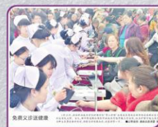
孝感日报报道 “孝心护理志愿者服务队” 义诊送健康活动