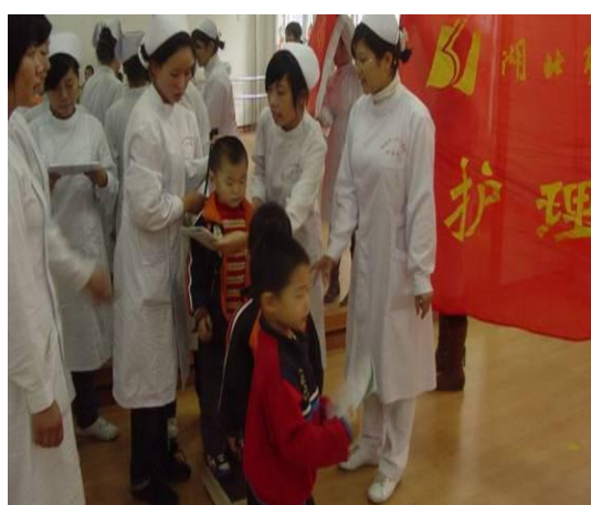
图4 孝心护理服务队进儿童福利院