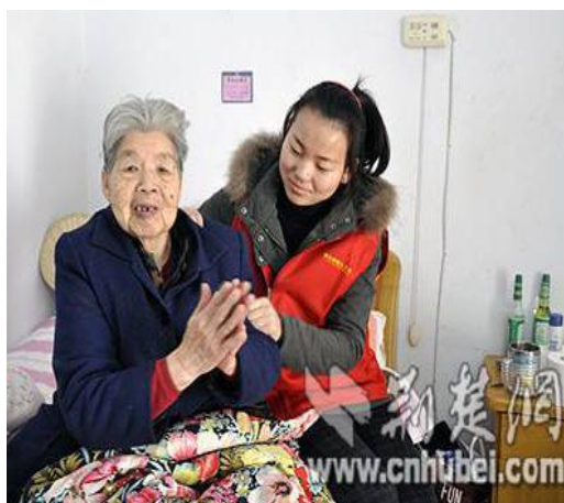
图3 义工进家庭关爱孤寡老人