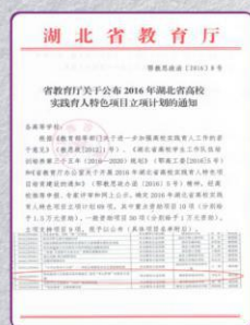
实践育人项目立项文件

湖北职院护理专业以孝感建设孝文化名城为依托，在优秀地域文化与时代精神相融合的校园文化氛围中，以“孝心护理”志愿服务实践团队为平台，以关爱孤寡老人、空巢老人、独居老人为重点，深入社区、养老院、福利院等开展健康体检、老年护理、健康教育等专业志愿服务，一方面实现了学生职业素质和专业技能的双提升，“孝心护理”文化阵地成为实践育人的有效载体；另一方面为“高校志愿服务+社区居家养老”的养老模式探索经验，“孝心护理”文化育人成为学校服务区域发展的重要举措。护理专业经过近10年的探索与实践，形成了“孝心护理”文化育人特色。