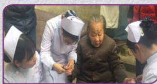
关心社区空巢老人