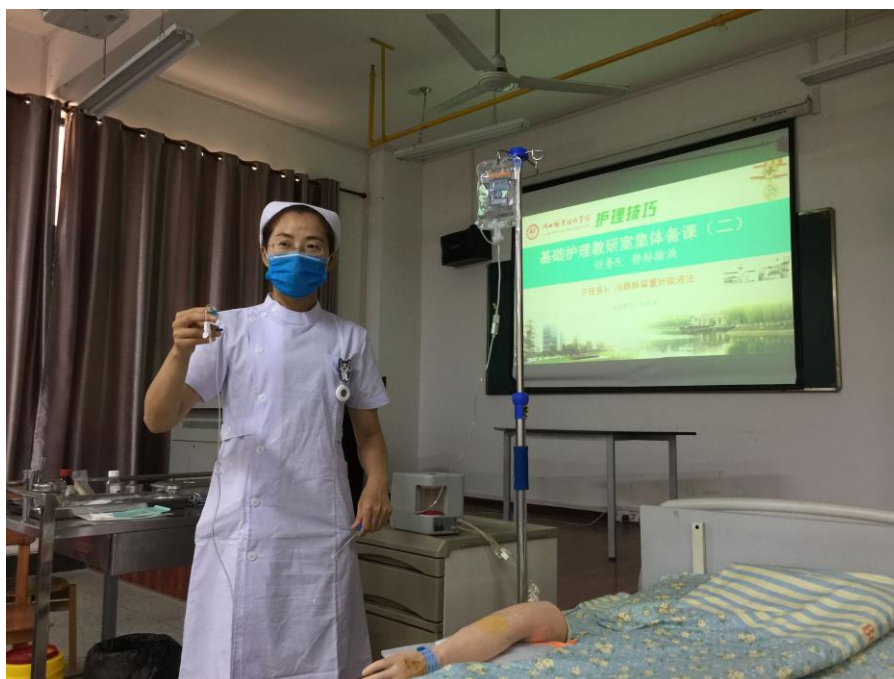
图 1 静脉留置针输液法集体备课

明确了主题，那么采取什么形式呢？既然是操作项目，仅仅做理论上的研讨肯定不足，必然需要现场示范，集体讨论，必要时动手演练，这样各位老师才能亲身体会操作中的细节问题，以便更好地指导学生，因此，没有什么比集体备课更合适的活动形式了。