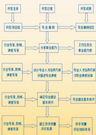
护理专业教学标准开发流程图