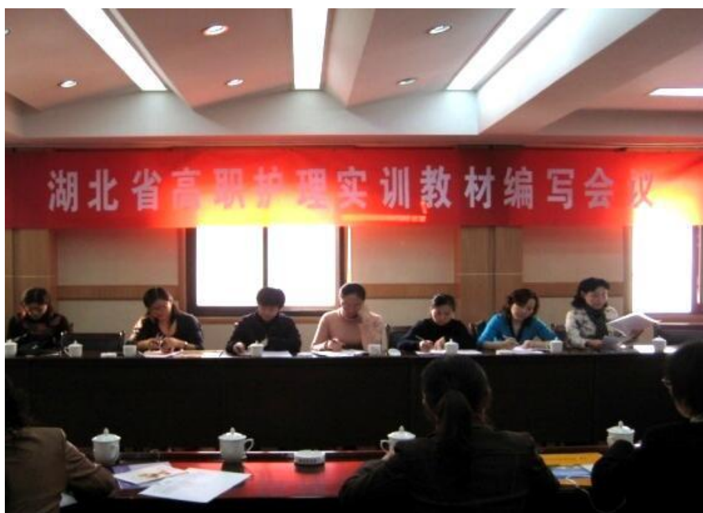
图 3 教材编写会议