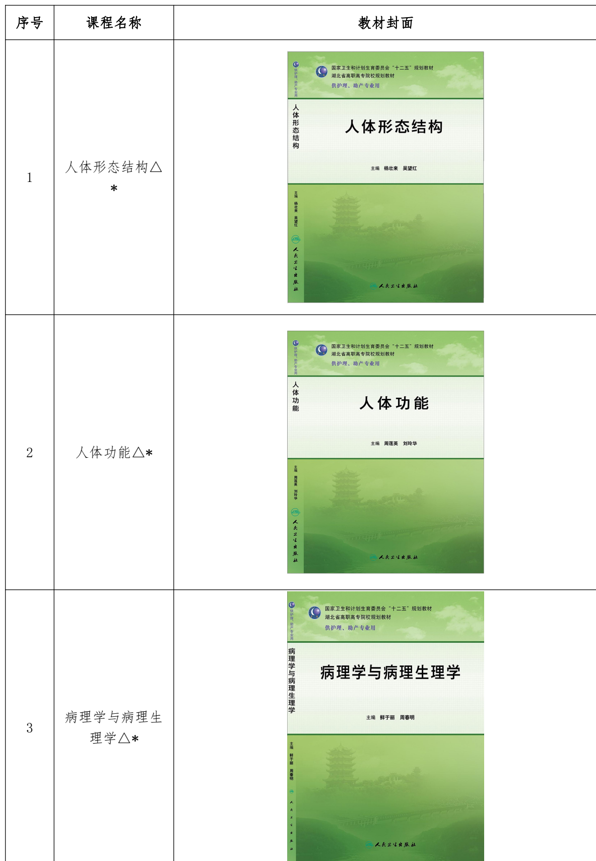
表 2 教材展示