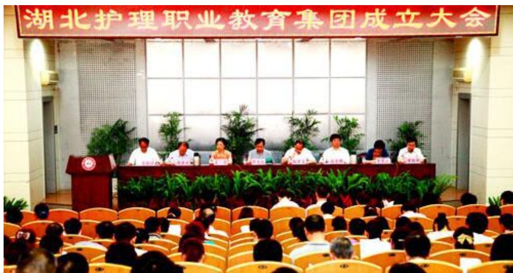
图 1 职教集团成立大会

依托护理职教集团，联合人民卫生出版社，组织集团学校骨干教师和临床护理专家共同编写出版了湖北省十二五高职护理专业区域规划教材（全套 28 册），经过一年多的试用，反应良好，促进了教学质量改革，提高了人才培养质量。