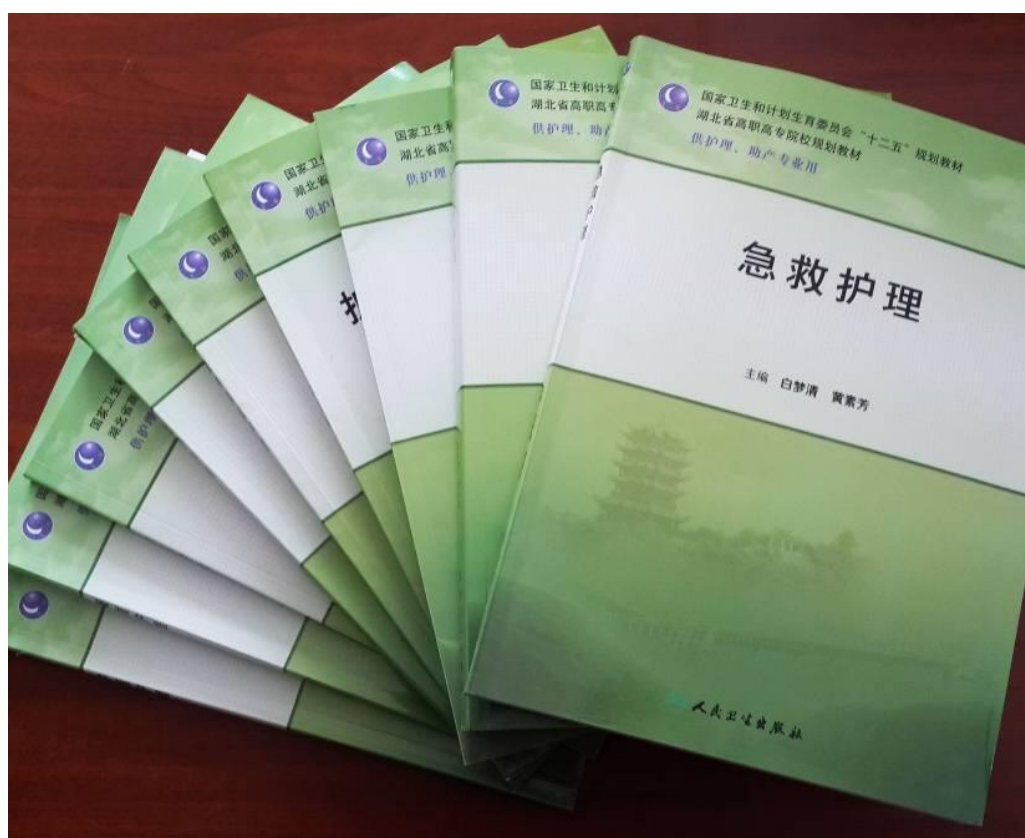
图 4 人卫部分教材