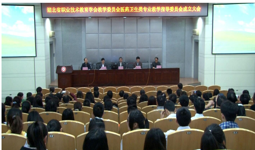
图 2 专业教学指导委员会成立大会