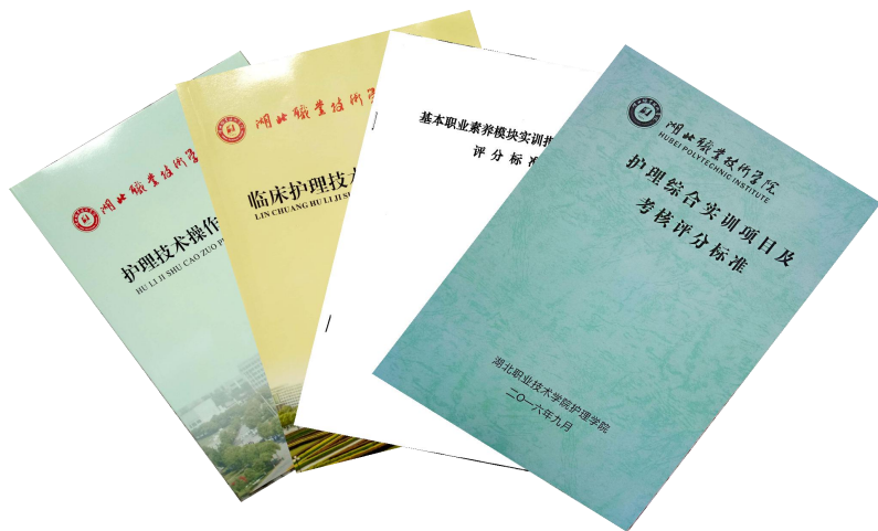
图 1 考核评分标准