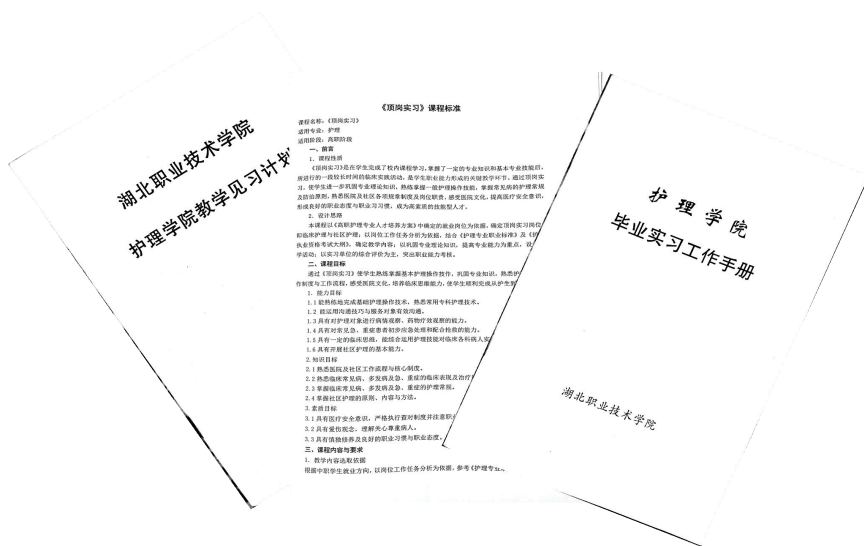
图 3 顶岗实习课程标准及实习见习手册