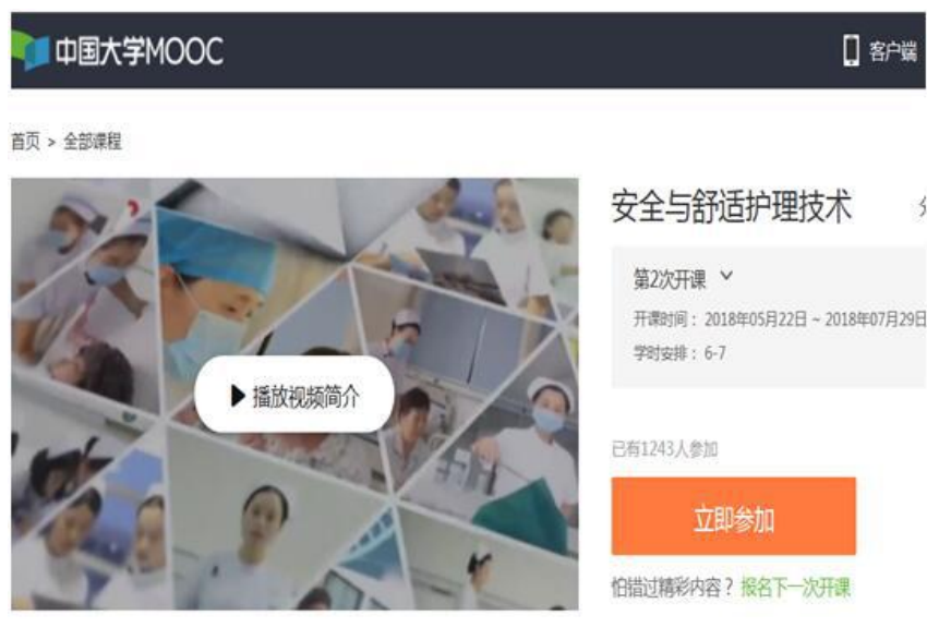
图 7 《安全与舒适护理技术》在线开放课程