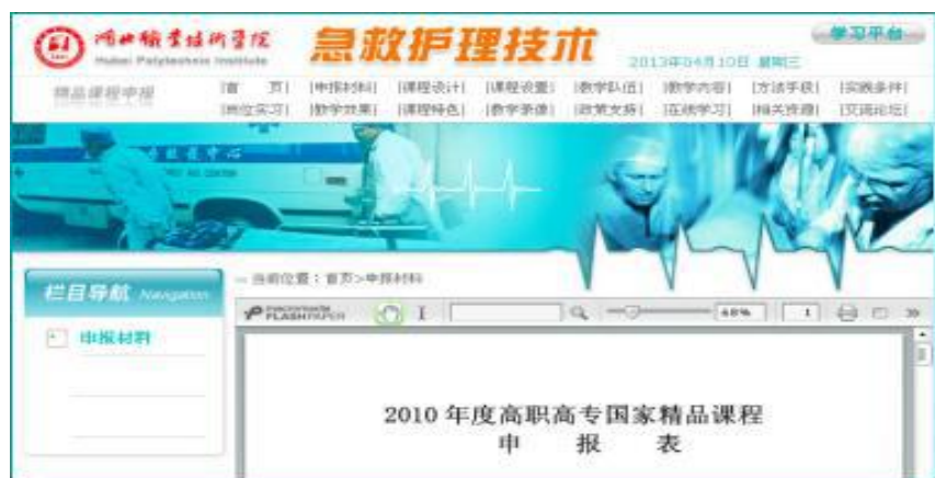
图 6 共建《急救护理技术》省级精品课程