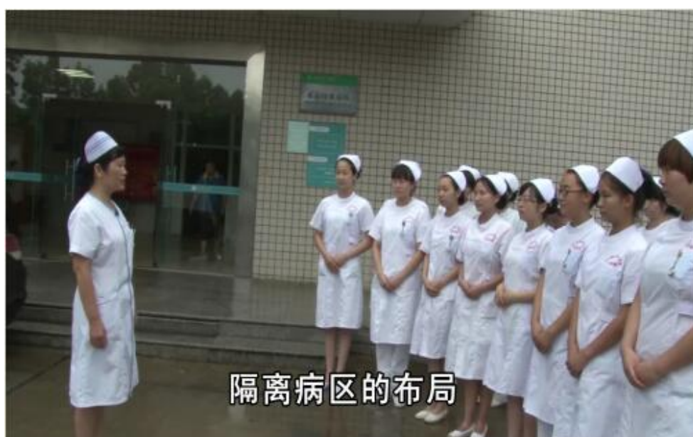
图 9 共同完成教学——现场教学