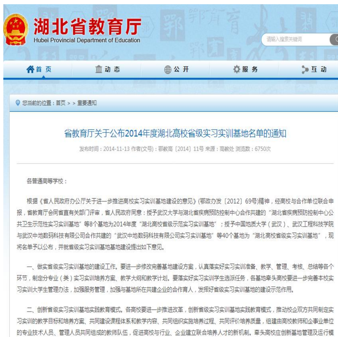
图 1 湖北省教育厅文件通知

2014 年经省教育厅批准，由湖北职业技术学院与孝感市中心医院联合建设的“孝感市校院合作临床技能实习实训基地”为“湖北高校省级示范基地”。成立之后，推动了院校深度融合，加强了双师型教师队伍建设。实现了校企双方共同制定实习实训的教学目标和培养方案、共同建设课程和教学内容、共同组织实施培养过程、共同评价培养质量，促进高校与行业、医院建立联合培养人才的新机制。