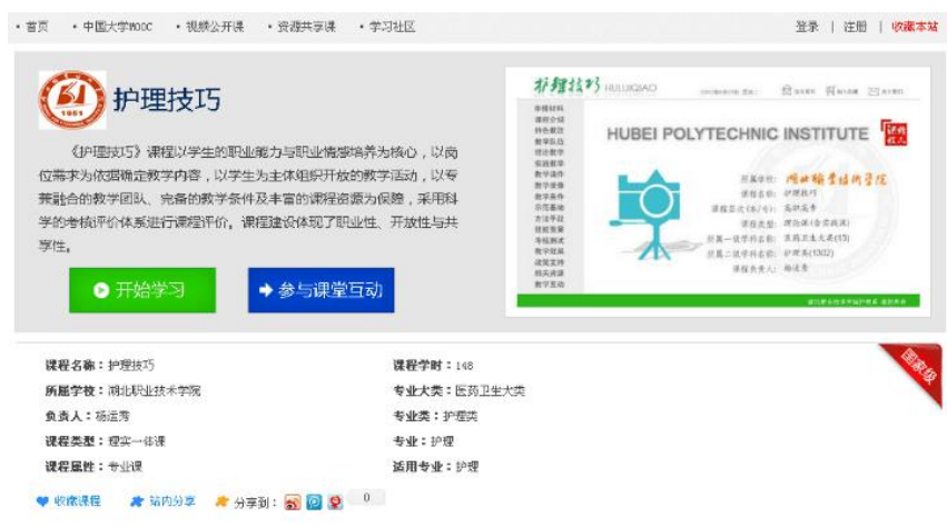
图 5 共建《护理技巧》国家精品课程