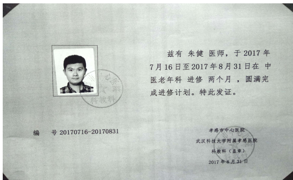
图 8 共建师资队伍——专职教师到临床进修