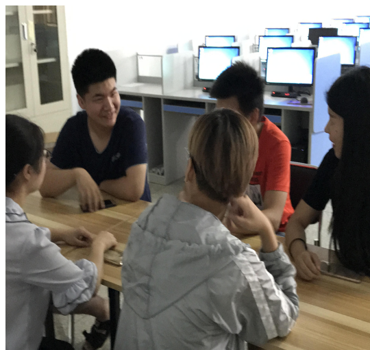
图 4 学生观后自主讨论