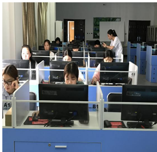
图 2 学生课外自主学习