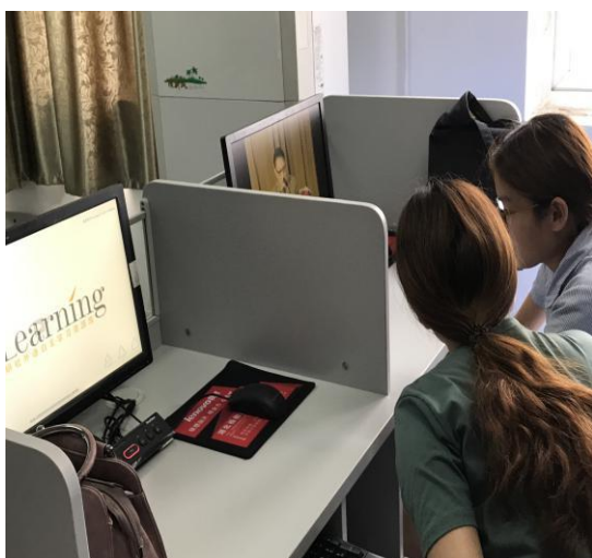
图 3 学生观看网络视频学习资料