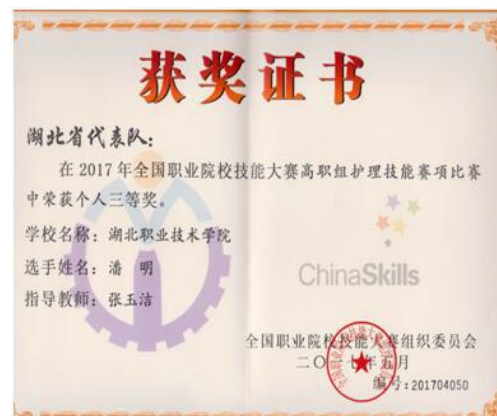
图 3 国赛获奖情况