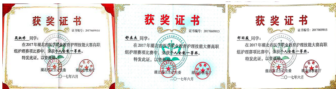
图 4 省赛获奖情况