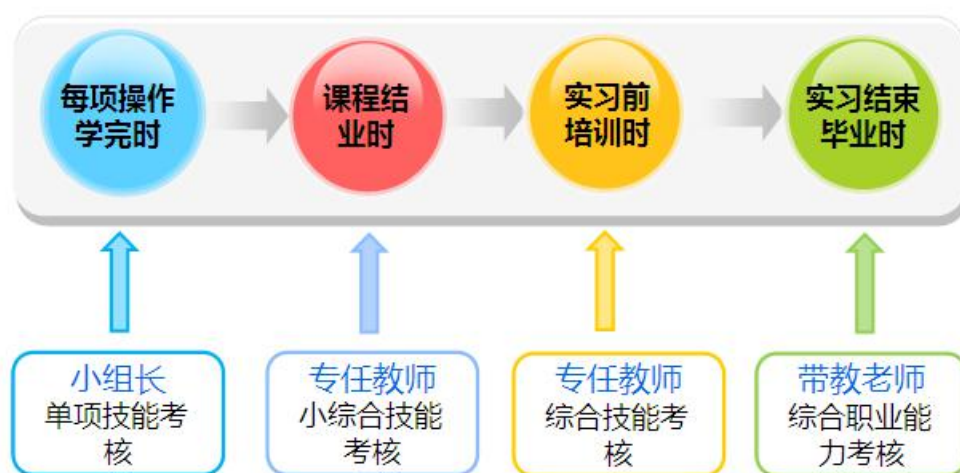
图1 考核评价体系——“四级”“三方”

为了全面考核学生的职业能力，突出职业教育的特点，构建了“四级、三方、多元”的考核评价体系。“四级”：一级考核是课程学习中，每项操作学完后由小组长进行单项技能考核；二级考核是课程结业时由任课教师组织的小综合技能考核；三级考核是实习前培训后，由护理学院组织的综合技能考核；四级考核是实习结束毕业时由医院带教老师对学生进行综合职业能力的考核。“三方”即学生、学校、医院；“多元”指评价内容多元，包括知识、技能、安全、沟通能力、创新意识、合作精神及人文关怀理念等素质。