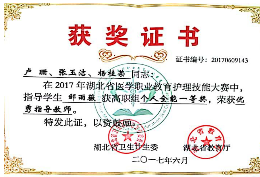
图4 湖北省医学职业教育护理技能大赛个人全能一等奖