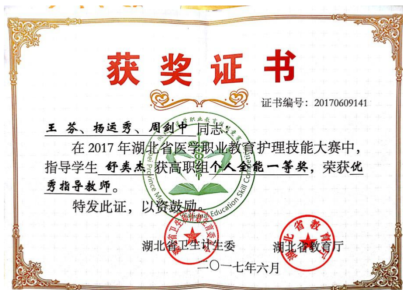
图3 湖北省医学职业教育护理技能大赛个人全能一等奖