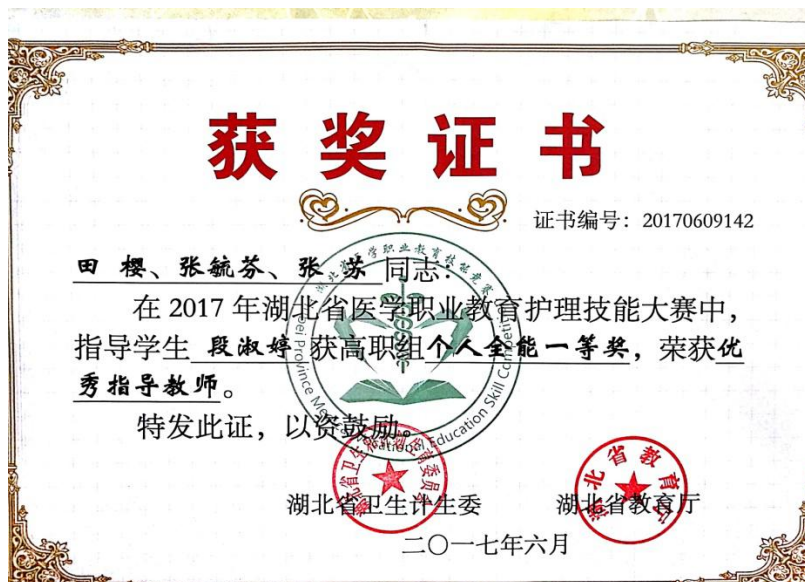
图 5 湖北省医学职业教育护理技能大赛个人全能一等奖